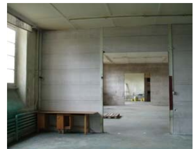
Etat actuel du rez-de-chaussée supérieur

L'espace intérieur est complètement vidé de son contenu actuel (doublages, chapes, faux-plafonds etc.), seuls les piliers porteurs existants sont maintenus. Puis démontage de l'ancienne distribution de chaleur et agrandissement des ouvertures de façade jusqu'au niveau du fond. Mise en place de nouvelles fenêtres et construction d'un balcon sur une bonne partie de la façade est. Façon d'une nouvelle chape sur la dalle existante avec incorporation du chauffage par le sol. Fabrication de mezzanines sur certaines parties des surfaces et construction de plusieurs escaliers d'accès à celles-ci. Aménagement d'une cuisine de conditionnement et de différents espaces sanitaires au rez et en mezzanine avec ce que cela implique au niveau des équipements de ventilation. Cloisonnement des espaces de vie, de service et administratif, aménagement du mobilier fixe et décoration. Création d'un local dépôt stock et d'une buanderie au sous-sol. Aménagement du jardin, création de deux rampes d'accès au balcon et pose de divers équipements de jeux pour enfants.