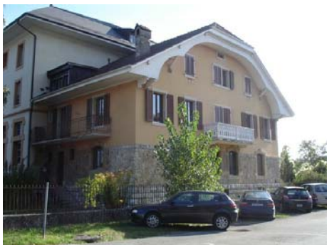
Partie villa non traitée dans ce projet

L'intervention traite de la partie industrielle du bâtiment. La partie villa (photos ci-dessous), correspondant aux appartements, n'entre pas dans ce projet. Actuellement elle est partiellement louée. Seules les installations techniques (production de chaleur et introduction d'eau) distribuant les deux parties sont prises en compte.