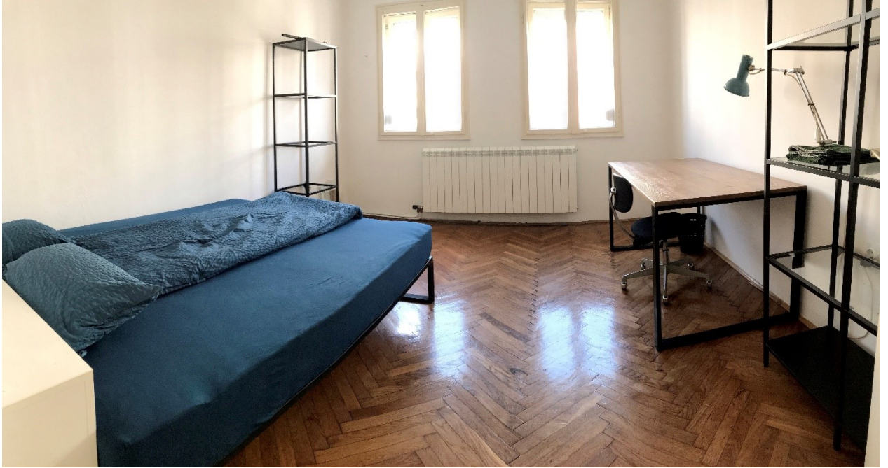
1 ère chambre