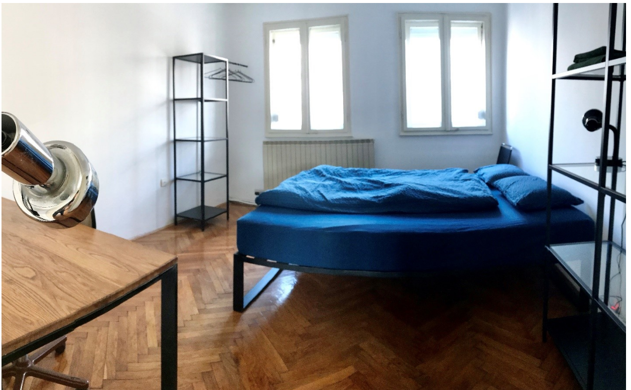
2 ème chambre