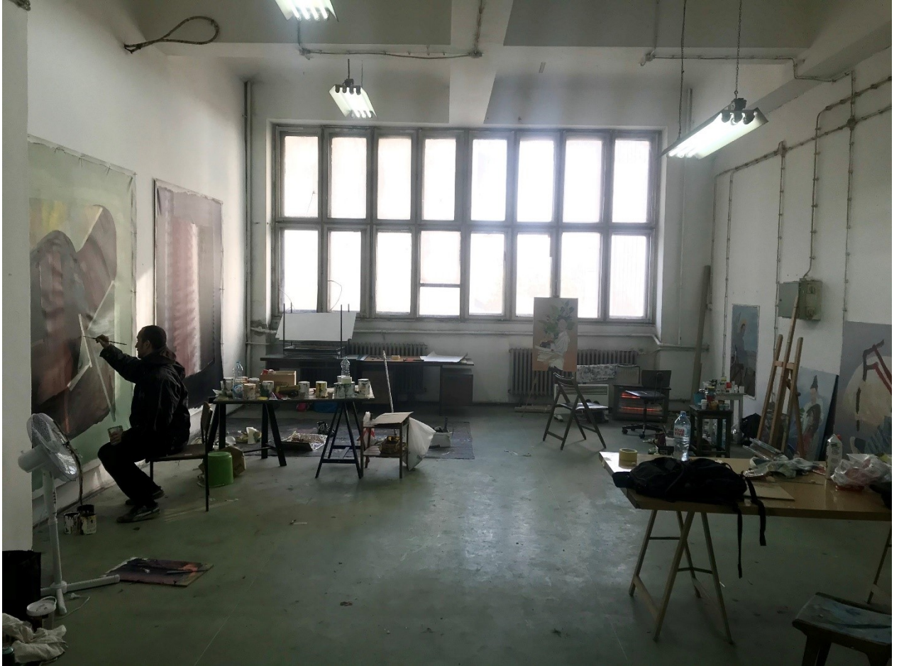
pièce de travail externe